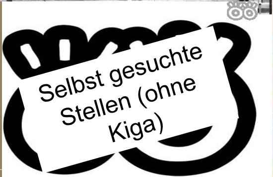
Selbst gesuchte Stellen (ohne Kiga)