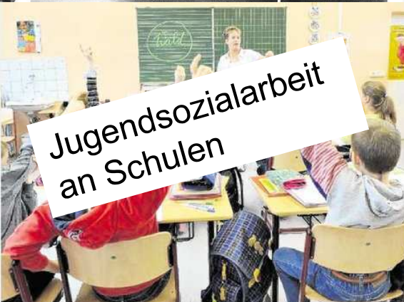
Jugendsozialarbeit an Schulen