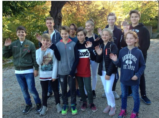
Die frisch gewählten Schülersprecher(innen) und Mini-Schülersprecher(innen) für das Schuljahr 2017/2018 sehen gut gelaunt ihren Aufgaben entgegen!